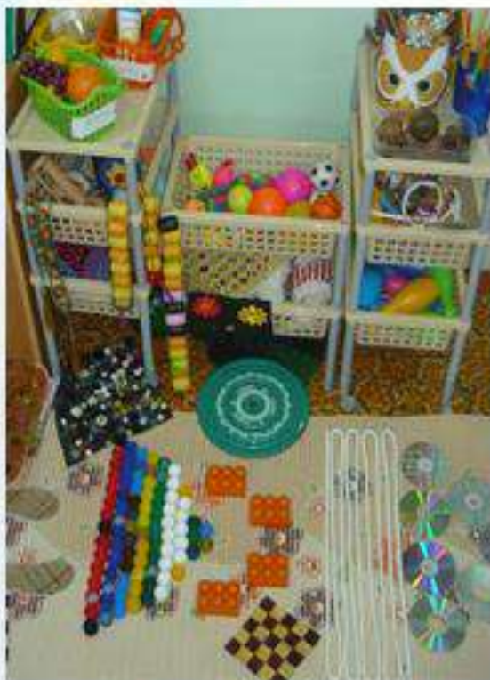
Младший дошкольный возраст