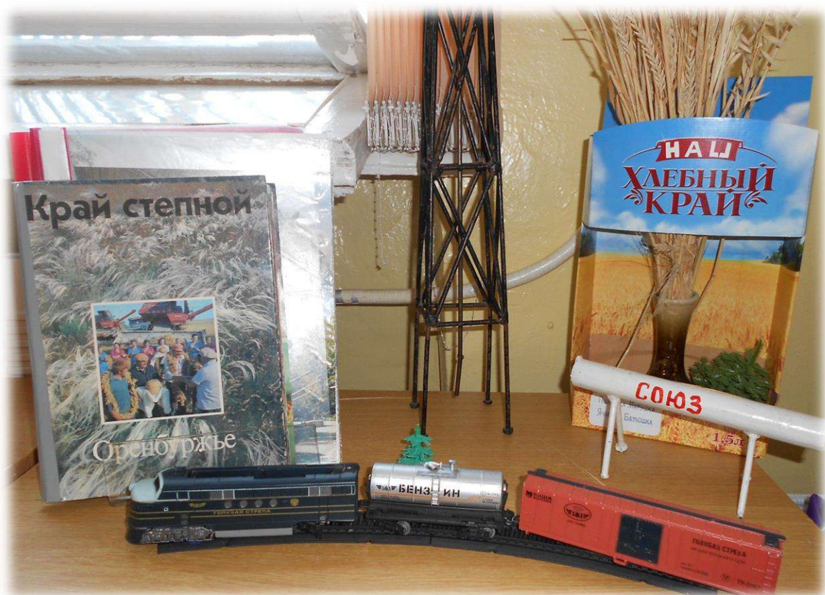
Центр трудовой активности